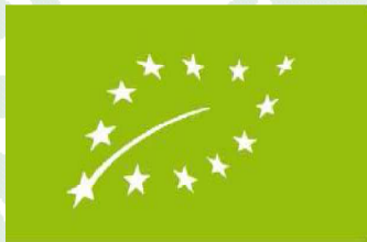
Logo Orgánico de la UE

Por ejemplo: DE-ÖKO-999 (El código numérico debe estar en el mismo campo de visión que el logo)